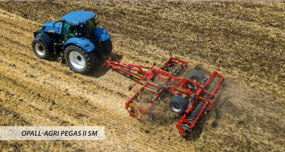
OPALL-AGRI PEGAS II SM