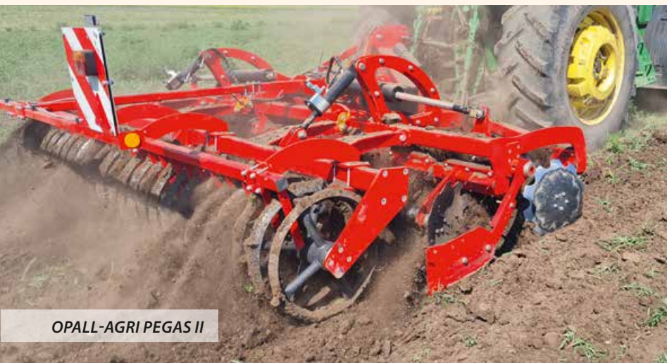
OPALL-AGRI PEGAS II