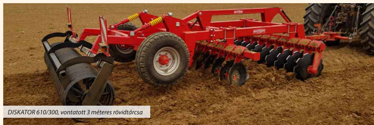
DISKATOR 610/300, vontatott 3 méteres rövidtárcsa