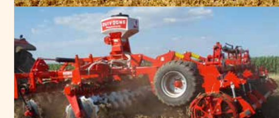
Combidrill aprómagszóró egység (opció)