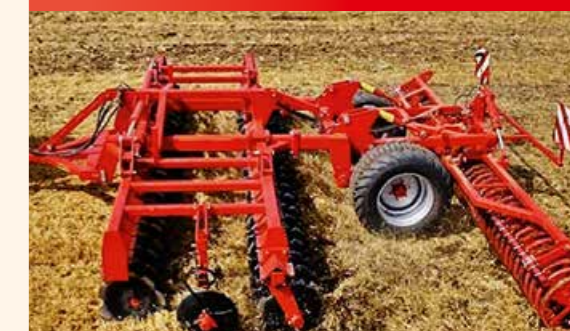
A tárcsasorok közötti távolság 1440 mm