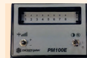
PM 100E vezérlő monitor