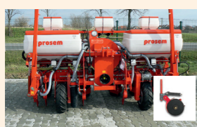
Műtrágyatartály 2 vagy 3 sorhoz, tárcsás csoroszlyával