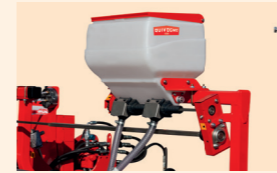
28 liter mikrogranulátum tartály minden kereskedelmi forgalomban kapható mikrogranulátum típushoz