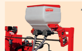
50 liter mikrogranulátum tartály minden kereskedelmi forgalomban kapható mikrogranulátum típushoz