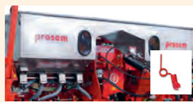
Központi műtrágya tartály, csúszó csoroszlyával