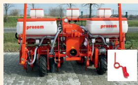
Műtrágyatartály 2 vagy 3 sorhoz, csúszó csoroszlyával