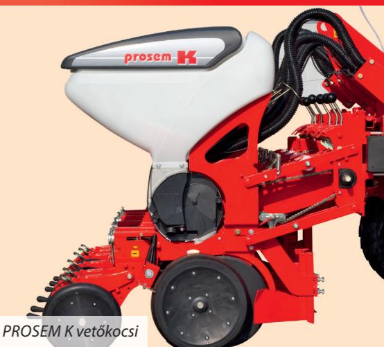
PROSEM K vetőkocsi