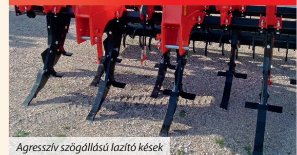
Agresszív szögállású lazító kések