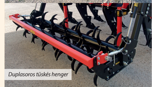
Duplasoros tüskés henger