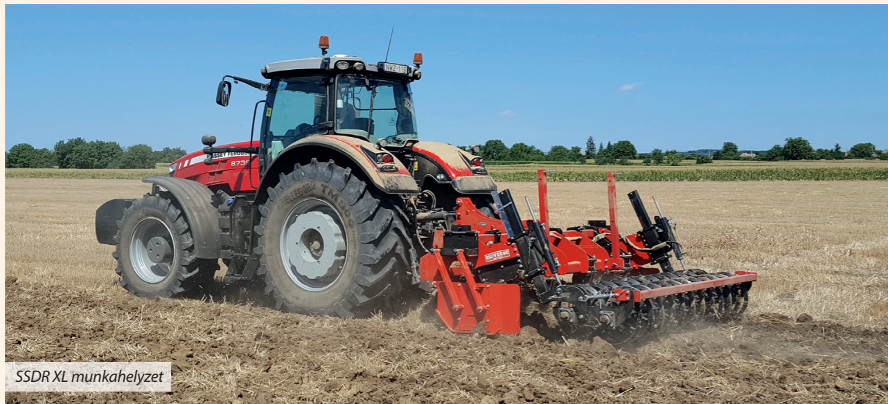
SSDR XL munkahelyzet