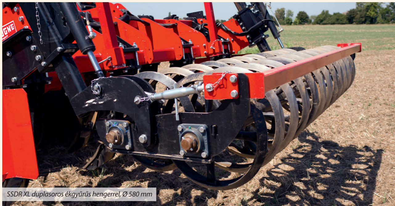
SSDR XL duplasoros ékgyűrűs hengerrel, Ø 580 mm