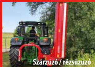
Szárzúzó / rézsúzó