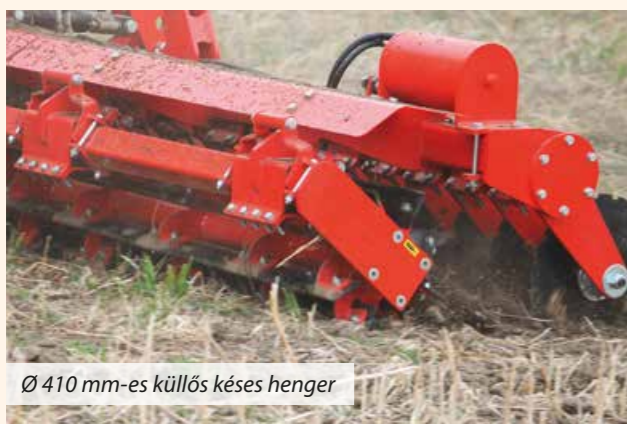
Ø 410 mm-es küllős késes henger