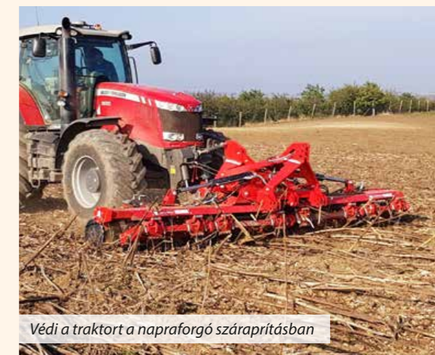
Védi a traktort a napraforgó száraprításban