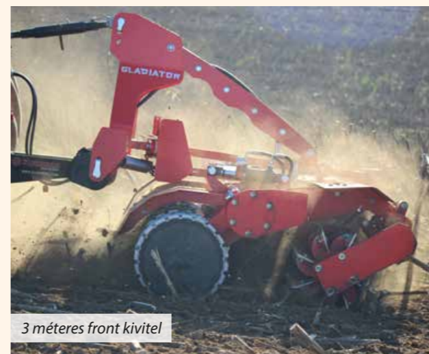
3 méteres front kivétel