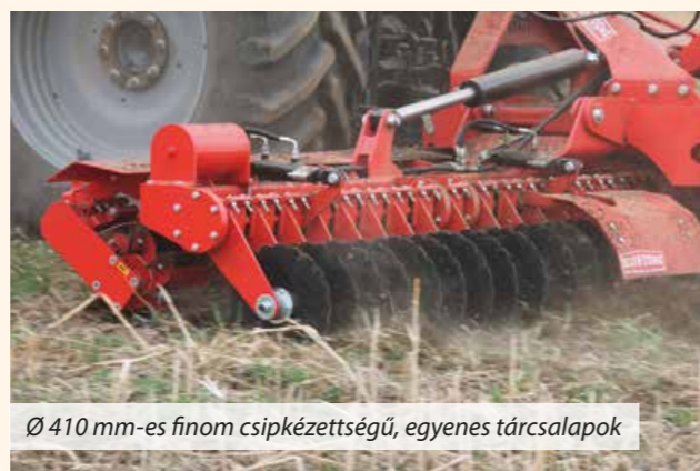
Ø 410 mm-es finom csipkézetségű, egyenes tárcsalapok